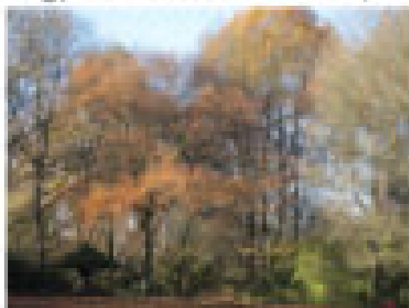
Im Wald mit Foto im Herbstpark

Als Finale unserer Spaziergänge durch die Jahreszeiten tanken wir noch einmal Natur mit allen Sinnen .