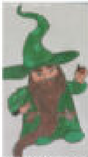
Der gute Geist des Eichtals Kraft von Melchior