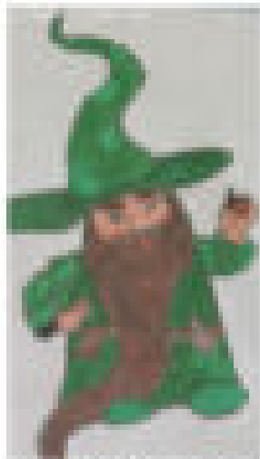
Der gute Geist des Eichtals Kraft von Melchior