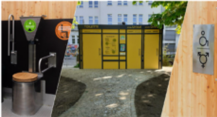
© Stadt Berlin 010 - Projekt: Green - 010 - Projekt: Green - 010 - Projekt: Green

Eine öffentliche und kostenlose Parktoilette für den Eichthalpark!