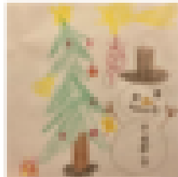
Eva, 8 Jahre