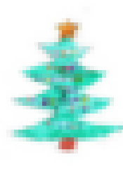
Lara, 10 Jahre